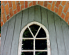
Reportage: Unterwegs mit Denkmalschützern