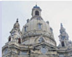
Dresden: Treffen des Fördervereins