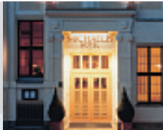
Mit der KiBa gewinnen: das Rätsel