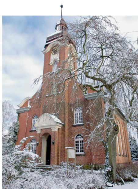
Gottesdienst im Freien: Dorfkirche Alt-Garbsen am Heiligabend

Seit zehn Jahren versammeln sich die Gottesdienstbesucher am Nachmittag des 24. Dezembers auf dem Platz vor ihrer Kirche, inzwischen sind es rund 700. Etwa 40 Minuten dauert der Open-Air-Gottesdienst: Die Weihnachtsgeschichte wird erzählt, man betet, singt, dann gibt es den Weihnachtssegen. Was es nicht gibt, sind Stühle. Dafür können alle Kirchgänger entspannt erst kurz vor dem Gottesdienst eintreffen; um einen guten Platz muss sich niemand sorgen. Für Menschen, die nicht lange stehen können, ist die Kirche geöffnet; die Feier wird in den Kirchenraum übertragen. Weihnachten unter freiem Himmel – die Idee dazu wurde aus der Not geboren: Zu klein ist die Dorfkirche für