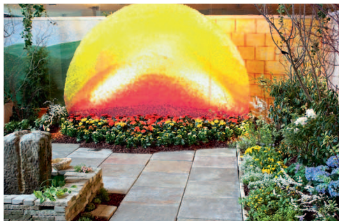
Licht und Leben: Auferstehungsstation im Ostergarten

So oder ähnlich geht der Weg durch einen der Ostergärten, wie sie in der Zeit um Ostern in immer mehr Kirchengemeinden in Deutsch-