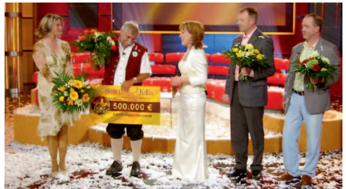
Walddorf/Sachsen siegte 2007 bei der letzten TV-Show mit der Stiftung KiBa. Jetzt haben drei Orte eine neue Gewinnchance

Es wird spannend werden, aber zum Glück geht niemand leer aus. Der Sieger erhält 300.000 Euro für dringend erforderliche Sanierungsmaß-