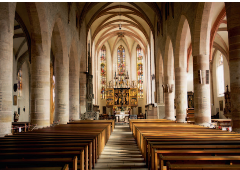
Blick in das Innere der dreischiffigen Staffelhalle: Die Schwabacher Stadtkirche beherbergt viele originale Kunstschätze aus dem 15. Jahrhundert