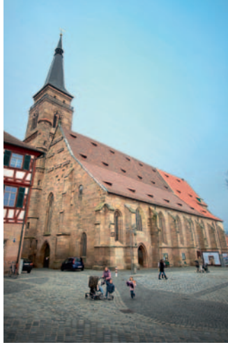
St. Johannes und St. Martin, Kirche in Schwabach