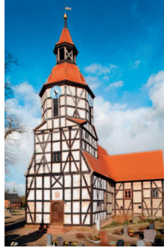
Kreuzkirche in Klieken