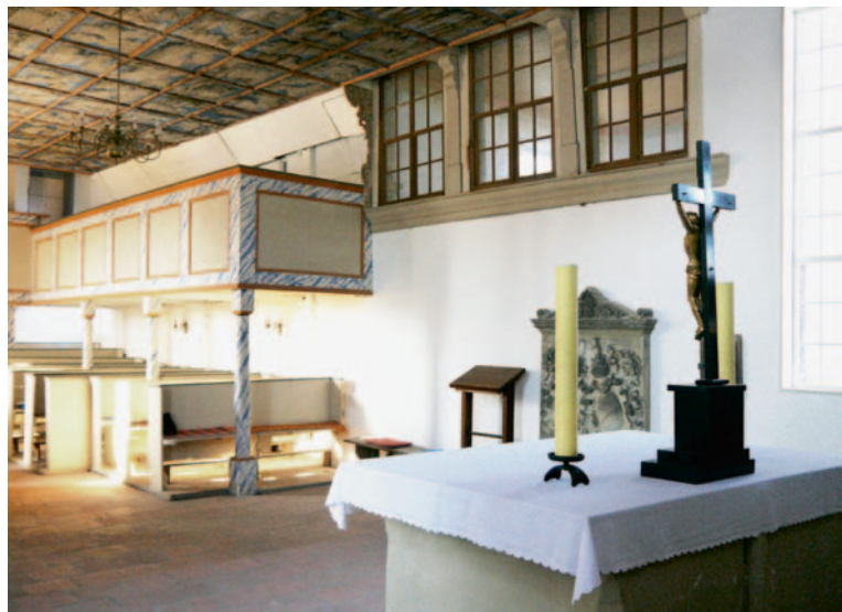
Auf dem Altartisch in Klieken soll bald wieder der Cranach'sche Flügelaltar stehen

sein politisches Gewicht für die existenzbedrohte Kirche in die Waagschale: Er gründete den Initiativkreis „Dir werd' ich helfen!“, gemeinsam mit sieben Gleichgesinnten: hochrangigen Vertretern von Wirtschaft, Sport und Kirche. Gut eine Million Euro will der Initiativkreis für die Sanierung zusammenbringen. Die Hälfte ist schon geschafft, dank größerer Spenden von Unternehmen, vielen Einzelspenden und Sammelaktionen. „Wir haben in Schwabach ein Klima erzeugt, dass es Ehrensache ist, für die Stadtkirche zu spenden“, sagt der ehemalige Bürgermeister selbstbewusst. „Gestern rief mich eine ältere Dame vom Tanzkreis im evangelischen Haus an. Sie hätten schon längere Zeit für die Kirche gesammelt und nun 2300 Euro beisammen.“