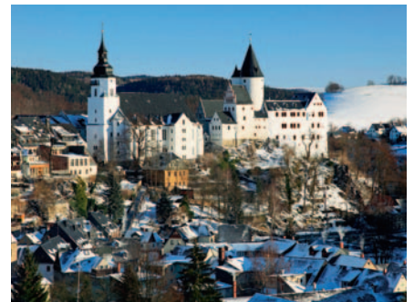
Blick auf Schwarzenberg im Erzgebirge mit Schloss und St. Georgenkirche. Die Holzschnitzerei hat hier eine lange Tradition

Kind ruft aus dem Nebenraum schüchtern: „Hallo?“ Rademann legt das Schnitzmesser auf die Werkbank und verschwindet im Durchgang. In seinem Laden in der Altstadt von Schwarzenberg verkauft er Schwibbögen, Weihnachtspyramiden, Krippen,