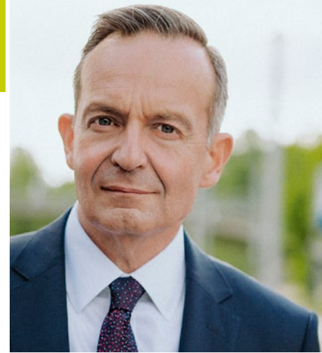
Volker Wissing war in vielen Ämtern als Politiker tätig, zuletzt bis 2025 als Bundesverkehrsminister. Jetzt arbeitet er als Rechtsanwalt

Das verleiht Kirchen eine besondere Bedeutung und Wirkung, jenseits der Architektur. In alten Kirchen, in denen Generationen gebetet, gedankt, gesungen, vertraut und gehofft haben, empfinde ich das besonders stark, so, als ob es sich vermehrt, wenn es oft geschieht. Es entsteht dadurch eine Geborgenheit, wie man sie von der eigenen Wohnung kennt. Kirchen zu erhalten, ist deshalb mehr als Denkmalschutz.