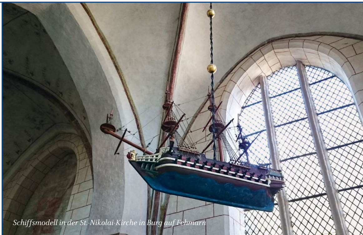
Schiffsmodell in der St.-Nikolai-Kirche in Burg auf Fehmarn