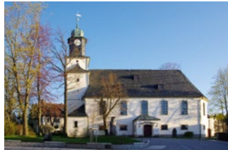
Die Stadtkirche in Zöblitz ist Gewinnerin im Wettbewerb

Die Stadtkirche im sächsischen Zöblitz ist die „Kirche des Jahres 2026“. Mit großem Abstand auf die anderen elf Kandidatinnen des Wettbewerbs siegte das gotische Gotteshaus, dessen Anfänge in das 15. Jahrhundert zurückgehen. 1904 bauten Handwerker den Kirchenraum im barockisierenden Jugendstil um.